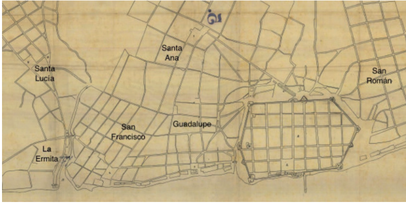
Imagen 2. La ciudad de Campeche y los barrios extramuros